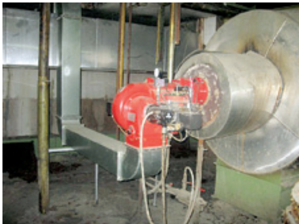
Ilustracija 3 Plamenik Monarch RGL5/1-D ugrađen u procesnom postrojenju

Za detaljnije informacije i tehničke podloge obratite nam se s povjerenjem.